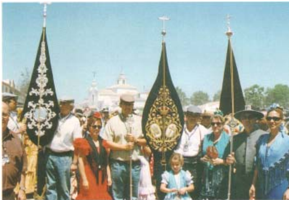
ACOMPAÑAMIENTO A LA HERMANDAD DEL ROCÍO DE PILAS EN SU PRESENTACIÓN ANTE LA VIRGEN DEL ROCÍO CON MOTIVO DEL 350 ANIVERSARIO DE LA ESPAMPA DEL SIMPECADO