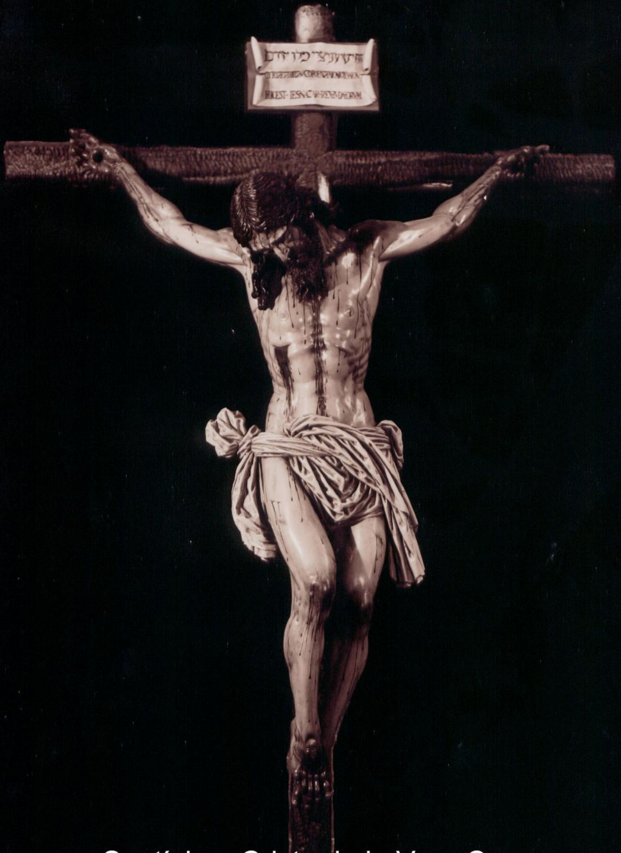
Santísimo Cristo de la Vera Cruz