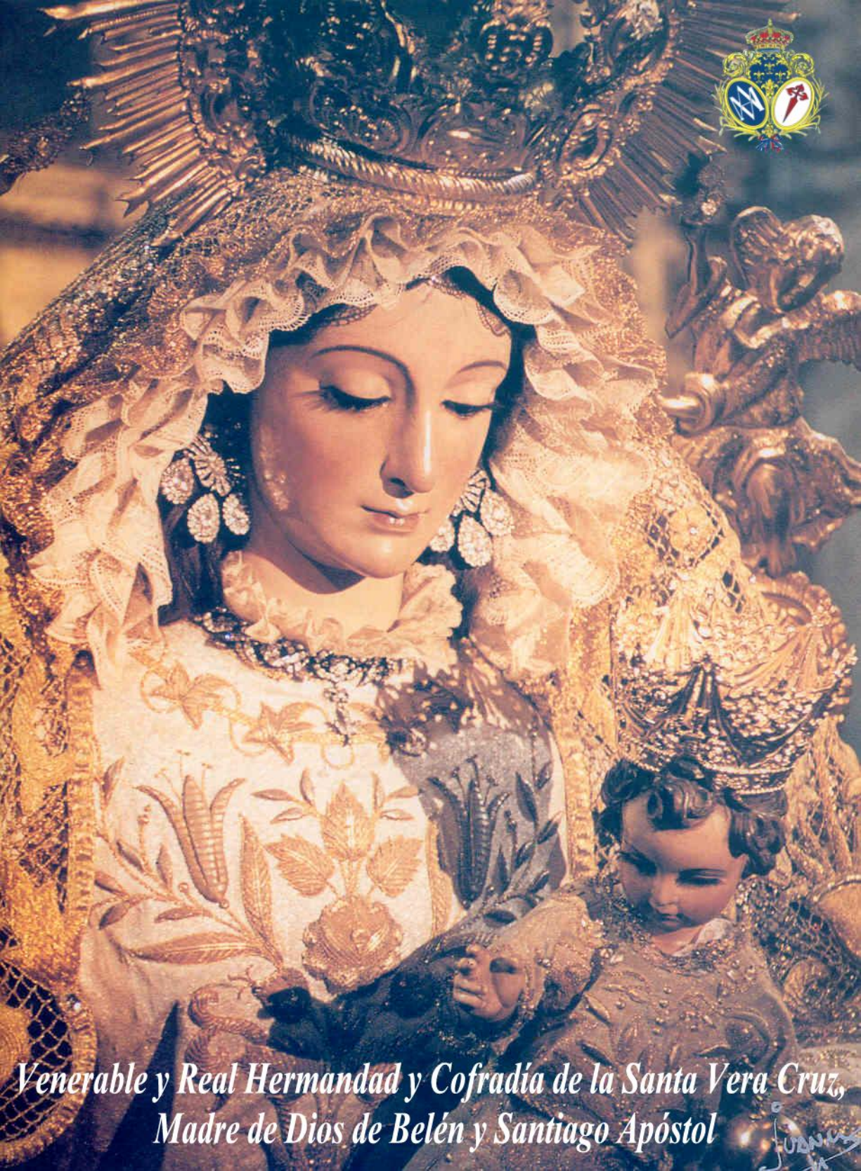
Venerable y Real Hermandad y Cofradía de la Santa Vera Cruz, Madre de Dios de Belén y Santiago Apóstol