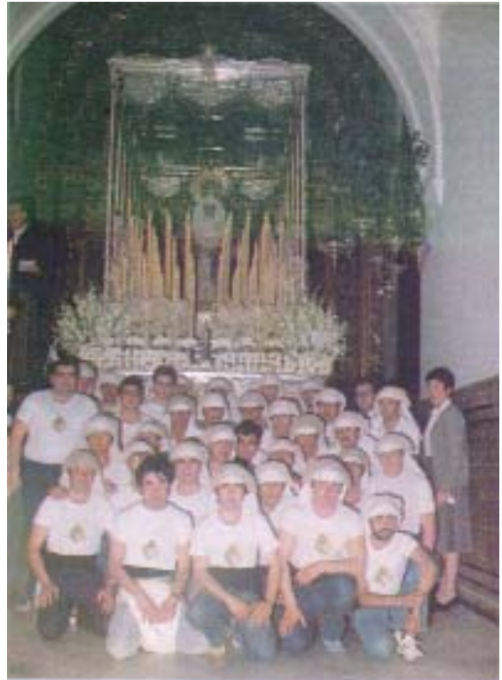
Primera Cuadrilla PASO VIRGEN AÑO 1.983

Otro de los días más maravillosos, fue el día en que la cuadrilla del Cristo llevamos a Nuestra Patrona la Virgen de Belén a la explanada del parque donde una inmensa multitud de pileños y foráneos esperaban orgullosos para ver como el Arzobispo de Sevilla Fray Amigo Vallejo coronaba las benditas sienes de Nuestra Señora, cumpliéndose así un sueño de todos los pileños. Una vez finalizado el acto, la Virgen procesionó triunfalmente por las calles de Pilas a hombros de las dos cuadrillas: la del Cristo y la del palio. ¿Qué suerte haberla llevado aquel día!