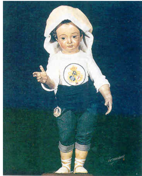
Niño de Dios de Belén vestido de Costalero

La Virgen llora la muerte de su hijo y en silencio pide la resurrección del que hoy es Rey de todos los hombres.