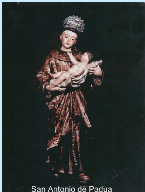
San Antonio de Padua