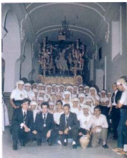
Primera Cuadrilla PASO CRISTO AÑO 1.984

Corría el año 1.983 cuando en Pilas, la primera cuadrilla de costaleros en la tarde del Jueves Santo sacaba bajo el dintel de la puerta de la Ermita el palio de Ntra. Madre y Patrona la Santísima Virgen de Belén. Aquel fue un año muy especial para todos los cofrades pileños, ya que por fin se empezaba a forjar una tradición que hoy en día ya está bastante consolidada. Desde aquel año, la afición por el mundo del costal se fue afianzando y ya el año siguiente se creaban dos nuevas cuadrillas: la del Santísimo Cristo de la Vera Cruz y la de Nuestra Señora de la Soledad. Ahora en el año 2001, todos los pasos que procesionan en nuestra Semana Santa lo hacen sobre los hombros de costaleros, que orgullosos se entregan de corazón para que su Cristo o su Virgen salgan a la calle lo más dignamente posible.