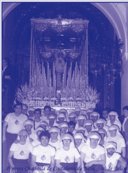
Primera Cuadrilla de Costaleros de Ntra. Sra. de Belén