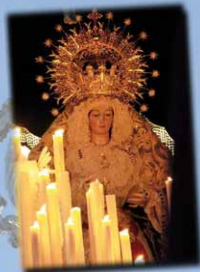
Jueves Santo: Stma. Virgen de Belén