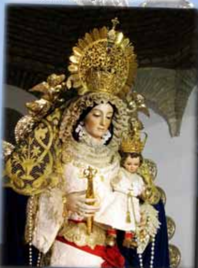
XIV Aniversario de la coronación de la Virgen de Belén