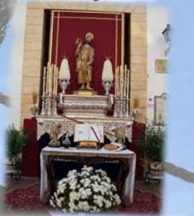
Día del Corpus Christi. Altar preparado en la puerta de la Ermita