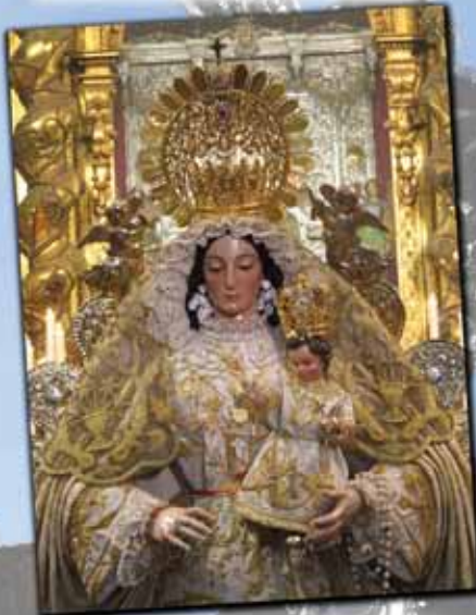
Besamanos a la Virgen de Belén