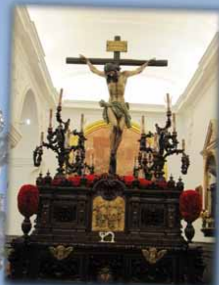
Jueves Santo: Stmo, Cristo de la Vera-Cruz