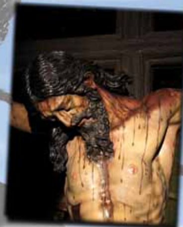
Quinario: Stmo. Cristo de la Vera-Cruz