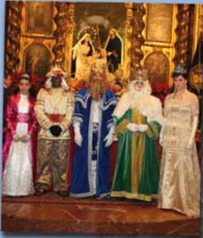
Adoración de los Reyes Magos