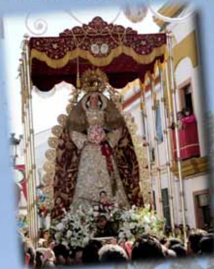
Domingo de Resurrección: Stma. Virgen de Belén